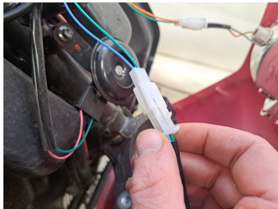
Avaa oikean etuvilkun liitin.